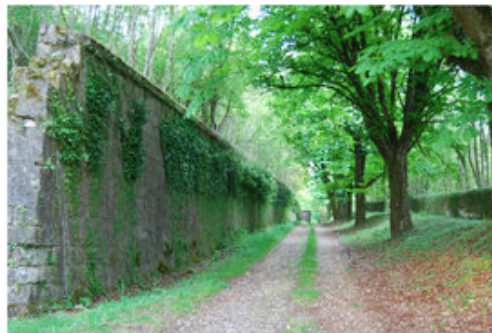
Les forts, parfois immergés dans la végétation, constituent un héritage culturel remarquable (Rouff).