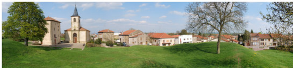
Un aménagement de placette original à Labry, adopté au contexte rural et ouvert sur l'espace public de l'ancienne motte féodale