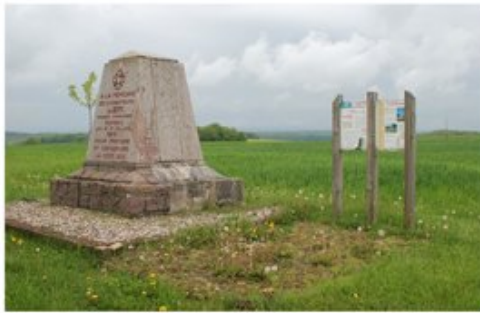
Panneaux explicatifs sur les combats de Reillon (juin 1915)