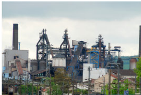
Le patrimoine industriel est un marqueur fort des paysages, principalement dans les vallées (Pont-à-Mousson)