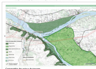
Cartographie des enjeux de paysage

© Agence Folléa-Gautier Paysagistes-Urbanistes - Conseil Général 54