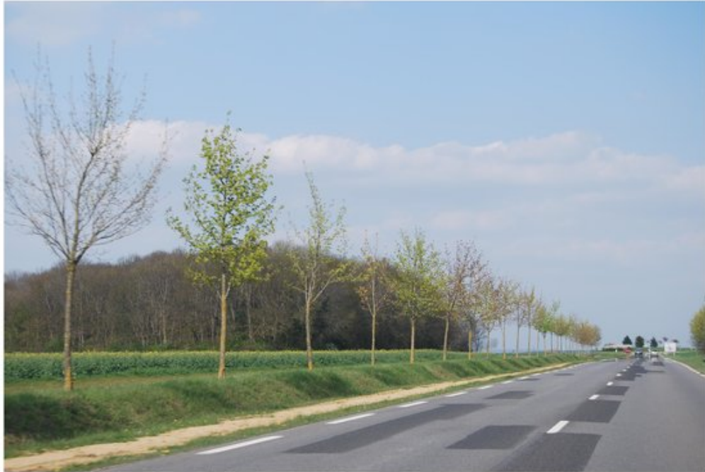
Cette replantation de la RD13H est judicieusement réalisée derrière un talus enherbé protecteur, ce qui évite l'utilisation de glissières standardisées.