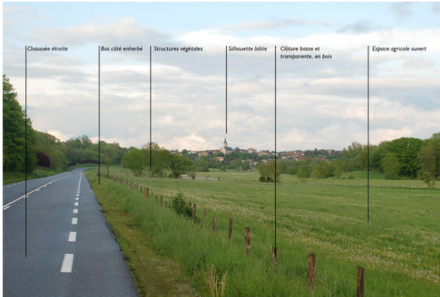
Route paysage permettant de découvrir la vallée de la Mortagne et le village de Moyen, au loin (RD 914). Sa qualité réside dans sa grande simplicité, les vues qu'elle offre et ses premiers plans dégagés.

Mettre en valeur le paysage perçu depuis la route et limiter au maximum la surenchère de mobilier routier