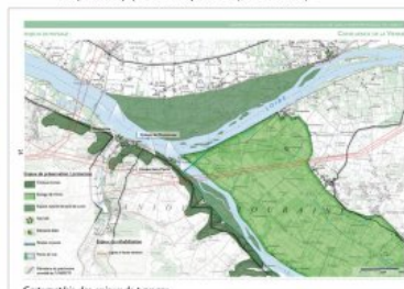
Cartographie des enjeux de paysage

© Agence Folléa-Gautier Paysagistes-Urbanistes - Conseil Général 54