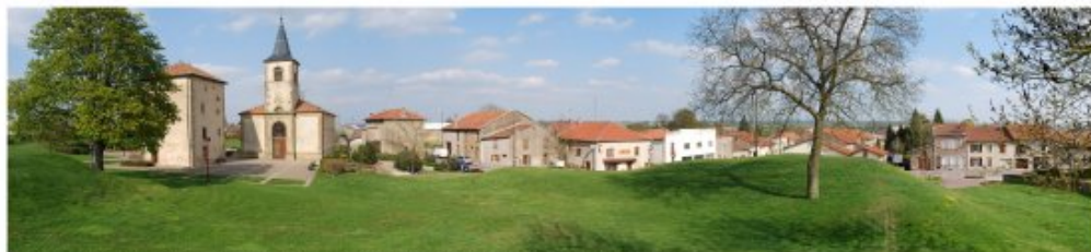
Un aménagement de place originale à Labry, adapté au contexte rural et ouvert sur l'espace public de l'ancienne motte féodale