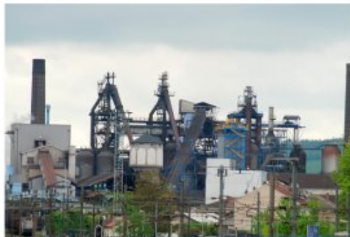
Le patrimoine industriel est un marqueur fort des paysages, principalement dans les vallées (Pont-à-Mousson)