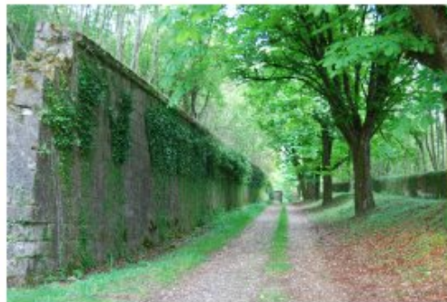
Les forts, parfois immergés dans la végétation, constituent un héritage culturel remarquable (Rouffes)