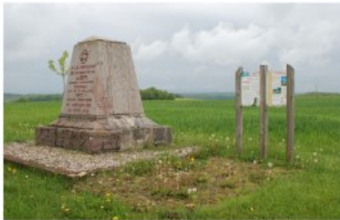
Panneaux explicatifs sur les combats de Reillon (juin 1915)