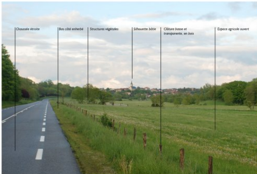
Route paysage permettant de découvrir la vallée de la Mortagne et le village de Moyen, au loin (RD 914). Sa qualité réside dans sa grande simplicité, les vues qu'elle offre et ses premiers plans dégagés.

Mettre en valeur le paysage perçu depuis la route et limiter au maximum la surenchère de mobilier routier