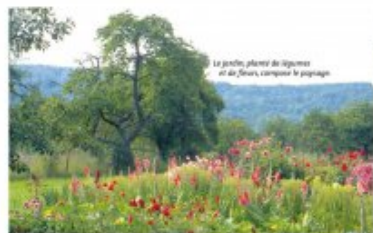
Exemple de jardin en transition entre espace agricole et urbanisation. Guides des Fleurs, arbres et arbustes du nord-est de la France, PNRL