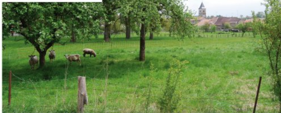
Exemple de prés-vergers existants en lisière du village de Coigny