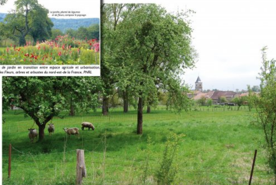
Exemple de prés-vergers existants en lisière du village de Coigny