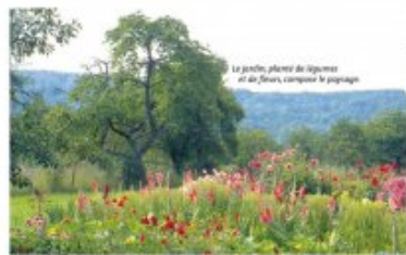
Exemple de jardin en transition entre espace agricole et urbanisation. Guides des Fleurs, arbres et arbustes du nord-est de la France, PNRL