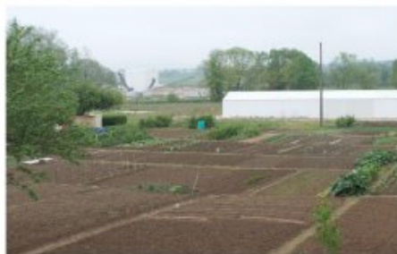
Maroichage (cultures de pleine terre) près de Nancy