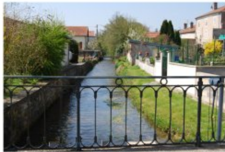
Le passage de l'eau dans les villages, mis en valeur par l'accompagnement de végétation, Villers-sous-Prény