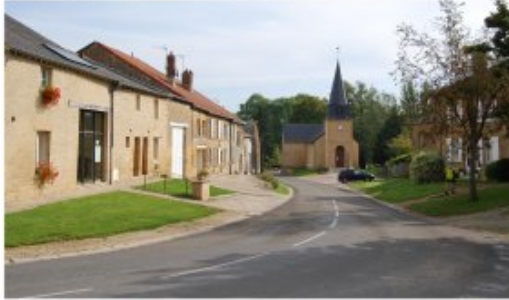
Mise en valeur des usoirs à Warnécourt, dans les Ardennes

© Agence Folléa-Gautier Paysagistes-Urbanistes - Conseil Général 54