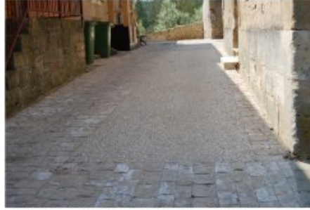
Aménagement des voies avec des matériaux de qualité, à Vardolainville