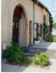
Mise en valeur des usoirs par la végétation, Crizilles