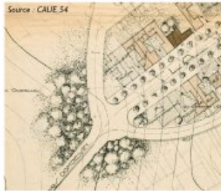
Plan d'Emberménil datant de 1920 faisant état d'un projet de plantation en bosquet en entrée de village afin de valoriser l'arrivée.