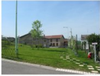
Restauration du charme des villages par la réintroduction de l'herbe dans l'espace public (Montreux)