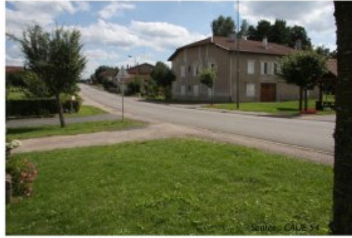
Requalification de la traversée du village à Nonhigny