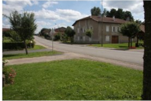
Requalification de la traversée du village à Nonhigny