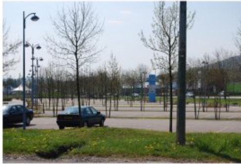
Les parkings font partie des espaces publics à soigner. Ici au nord de Pont-à-Mousson