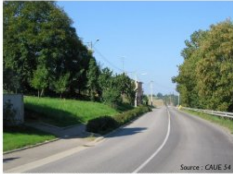
Création d'un trottoir et réduction de la largeur de la Chaussée à Sainte-Pôle