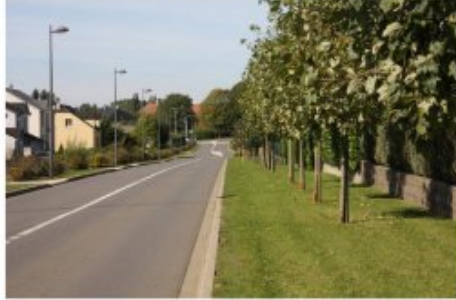
Requalification et plantation de la traversée du village à Chenières