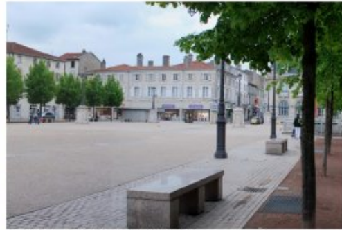
Une place bien redessinée : la place Léopold à Lunéville

© Agence Folléa-Gautier Paysagistes-Urbanistes - Conseil Général 54