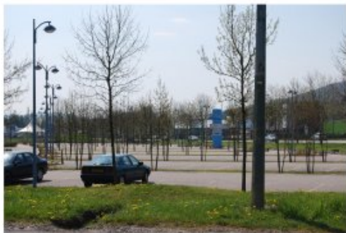
Les parkings font partie des espaces publics à soigner. Ici au nord de Pont-à-Mousson