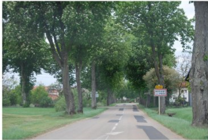
Exemple d'entrée de village marquée par un alignement d'arbres, créant une transition douce entre l'espace agricole et le village et valorisant le paysage perçu depuis la route.