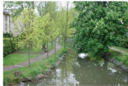
Promenades aménagées sur les bords de la Veauce à Lunéville